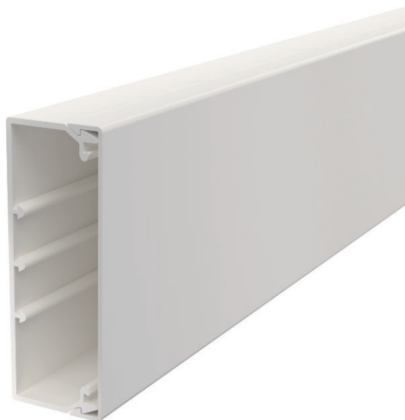
Kanaloverdel og -underdel med bundperforering.